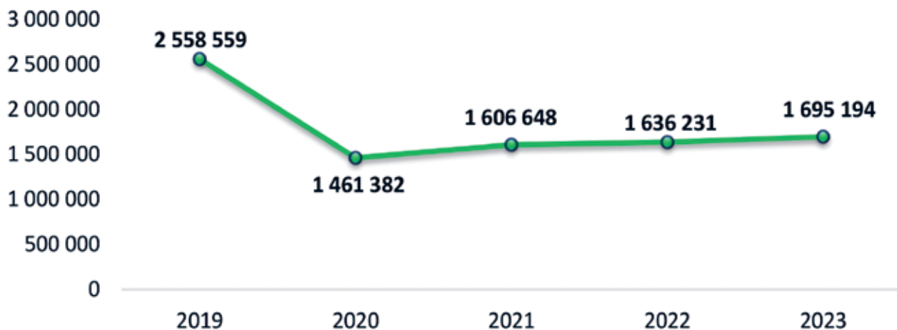
Рис. 2. Динамика количества заключенных договоров личного страхования за 2019–2023 гг.

Наибольшую долю (49,1 %) в структуре заключенных договоров личного страхования занимает добровольное страхование от несчастных случаев и болезней на время поездки за границу.